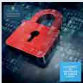
LGPD visa proteger os direitos fundamentais de liberdade e de privacidade no meio digital ou não.

De modo geral, a Lei Geral de Proteção de Dados não veio para proibir o tratamento e a manipulação de dados por terceiros, e sim para regular e padronizar as práticas, de modo a estabelecer uma relação de segurança jurídica, no que se refere a informações pessoais de todos os indivi-