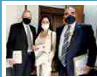
Deputada federal Geovânia de Sá (PSDB)