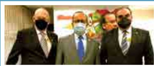
Senador Jorginho Mello (PL)