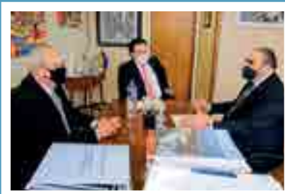
Deputado federal Rodrigo Coelho (PSB)