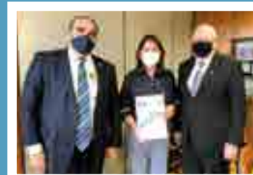
Deputada federal Carmen Zanotto (Cidadania)