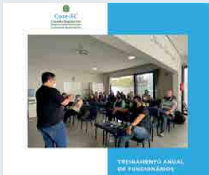
Sede e Delegacias Regionais do Core-SC ficaram fechadas no dia 5 de novembro para o treinamento anual de funcionários. O evento foi promovido na Delegacia Regional do Conselho em São José e tem como objetivo aprimorar o atendimento aos representantes comerciais e sociedade em geral.

O coordenador geral do Core-SC também destaca que novos procedimentos internos foram aplicados para garantir mais segurança no tratamento de dados de filiados, funcionários e fornecedores.