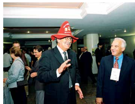
7º Encontro, 2005, Blumenau.