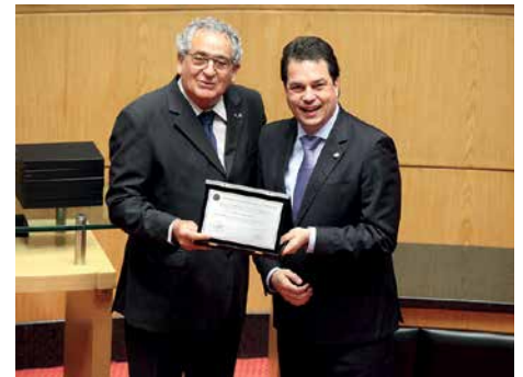
Homenagem recebida na Assembleia Legislativa de SC em 2015, pelos 50 anos da regulamentação da profissão de representante comercial.