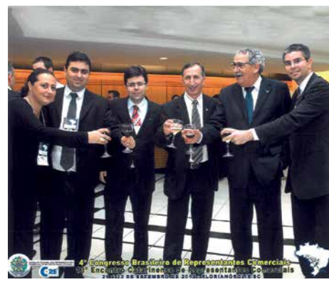
13º Encontro e 4º Congresso Brasileiro de Representantes Comerciais, 2012, Florianópolis.