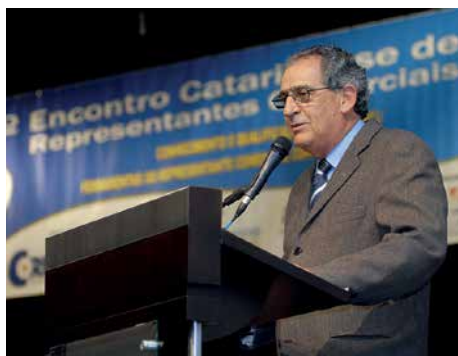
8º Encontro, 2006, Lages.