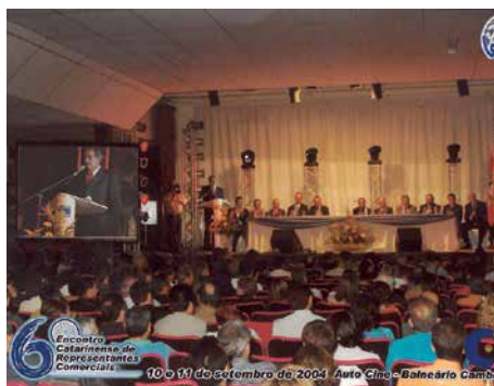
6º Encontro, 2004, Balneário Camboriú.