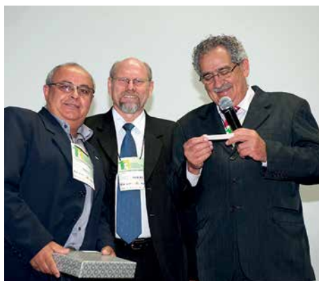
11º Encontro, 2009, Chapecó.