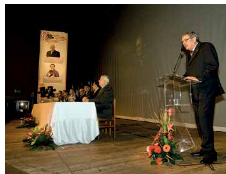
10º Encontro, 2008, Jaraguá do Sul.