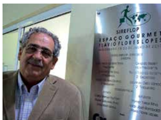
Homenagem do Sindicato dos Representantes Comerciais da Grande Florianópolis.