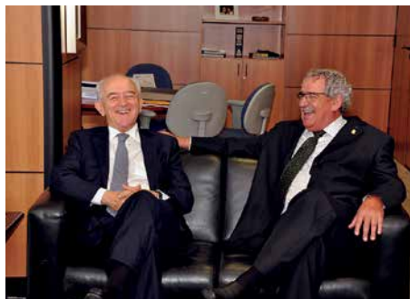
Com o amigo e então ministro do Trabalho e Emprego, catarinense Manoel Dias, em Brasília, em 2013.