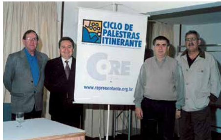
Promoveu centenas de palestras pelo Estado, sempre proporcionando qualificação profissional aos representantes comerciais.