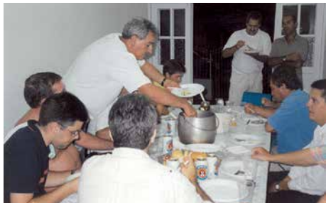
Sempre apoiou e participou ativamente das atividades dos sindicatos regionais que congregam a categoria em Santa Catarina