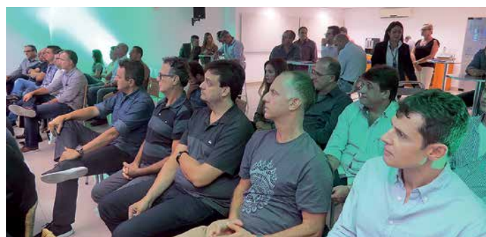
Filiados de setores da Representação Comercial diretamente atingidos – como calçados, ótica e confecção, colaboraram com o Seminário, relatando suas experiências e oferecendo sugestões.