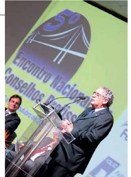
Como presidente da Associação dos Conselhos Profissionais (ASCOP/SC), dando boas vindas aos mais de 300 participantes na abertura do 5º Encontro Nacional dos Conselhos Profissionais, promovido em Florianópolis em 2013.