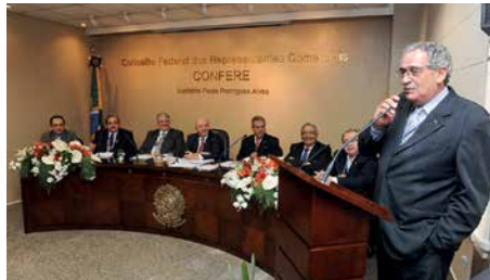
Atuação marcante como delegado junto ao Conselho Federal dos Representantes Comerciais, por quase 25 anos.