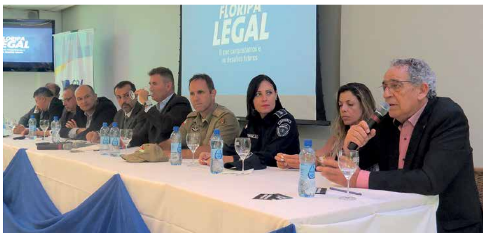
Ações foram definidas em Seminário promovido pela CDL Florianópolis, com apoio do CORE-SC