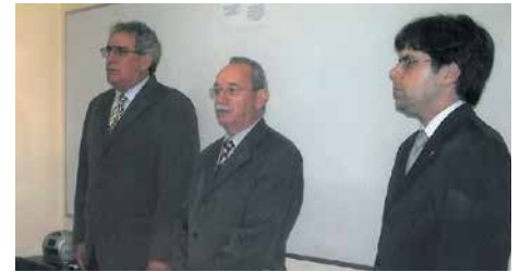
Solenidade de entrega de carteiras na Delegacia Regional do CORE-SC em Joinville, em 2006, ano que o evento começou a ser promovido em todo o estado com o objetivo de conscientizar quanto à importância da profissão e valorizar o exercício da atividade, além de informar sobre a atuação do Conselho aos novos representantes comerciais.