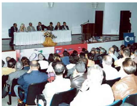
5º Encontro, 2003, Joaçaba.