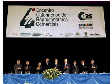
4º Encontro, 2002, Joinville.