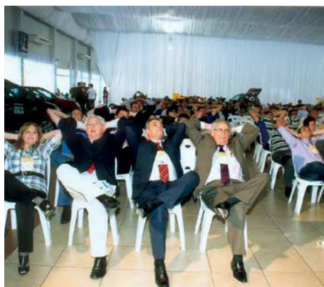
12º Encontro, 2010, Criciúma.