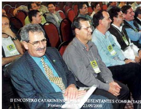
2º Encontro, 2000, Florianópolis.