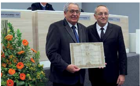
Homenagem recebida na Câmara de Vereadores de Lages em 2015, pelos 50 anos da regulamentação da profissão de representante comercial.

Muitas vezes o CORE-SC precisou se mobilizar em nível nacional com outras lideranças da categoria para garantir a manutenção dos direitos já conquistados pelos representantes comerciais.