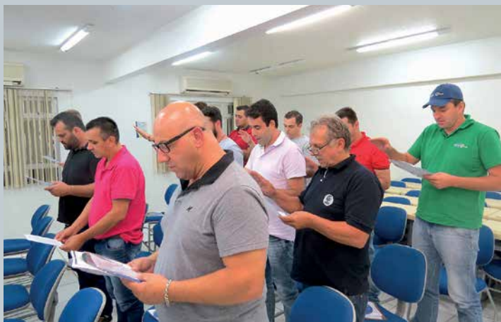
Juramento do Representante Comercial em Rio do Sul, município que recebeu o evento duas vezes em 2017, número de edições que será mantido para 2018.