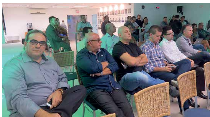
Diretores, coordenador geral e assessores do CORE-SC acompanharam o evento.