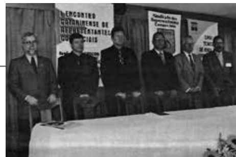
1º Encontro: 1999, em Blumenau

Promoveu 13 edições do evento que reuniu centenas de pessoas em várias cidades catarinenses: representantes comerciais e dirigentes da categoria de diferentes partes do Brasil. O evento era realizado em parceria com os sindicatos regionais de representantes comerciais de Santa Catarina.