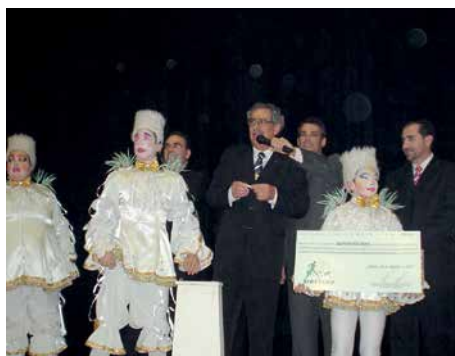
9º Encontro, 2007, São José.