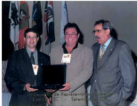
3º Encontro, 2001, Criciúma.